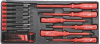
Destornilladores y llaves hex.