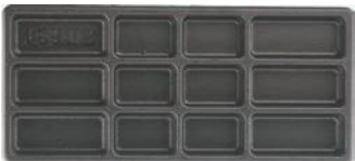
Bandeja con compartimentos.