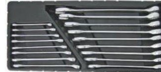
Llaves combinadas de 6 a 22 mm.