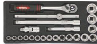
Vasos 1/2" y accesorios.