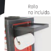
Rollo no incluido.