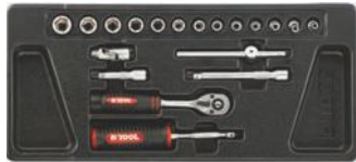
Vasos 1/4" y accesorios.

KIT PARA TALLER. Carro de herramientas distribuidas en los 5 cajones superiores de los 7 que dispone. Cierre de seguridad en cada cajón y una cerradura con centralizada con llave. Bandeja superior en plástico, ruedas giratorias para facilitar el movimiento, una con freno, guías de los cajones con bolas de acero, panel lateral perforado para colgar herramientas.