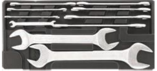
Llaves de 6 a 32 mm.