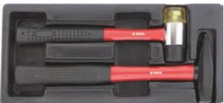
Martillo de carpintero y maza.