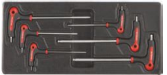
Llaves hex con mango en T.