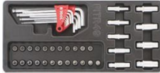
Vasos 1/4" y accesorios.