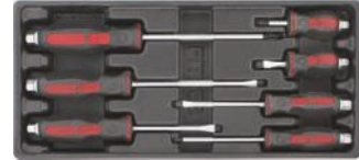
Destornilladores PH de impacto.