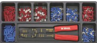
Alicate para engastar terminales.