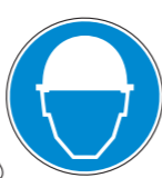
Protección obligatoria de la cabeza