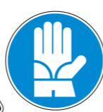
Protección obligatoria de las manos